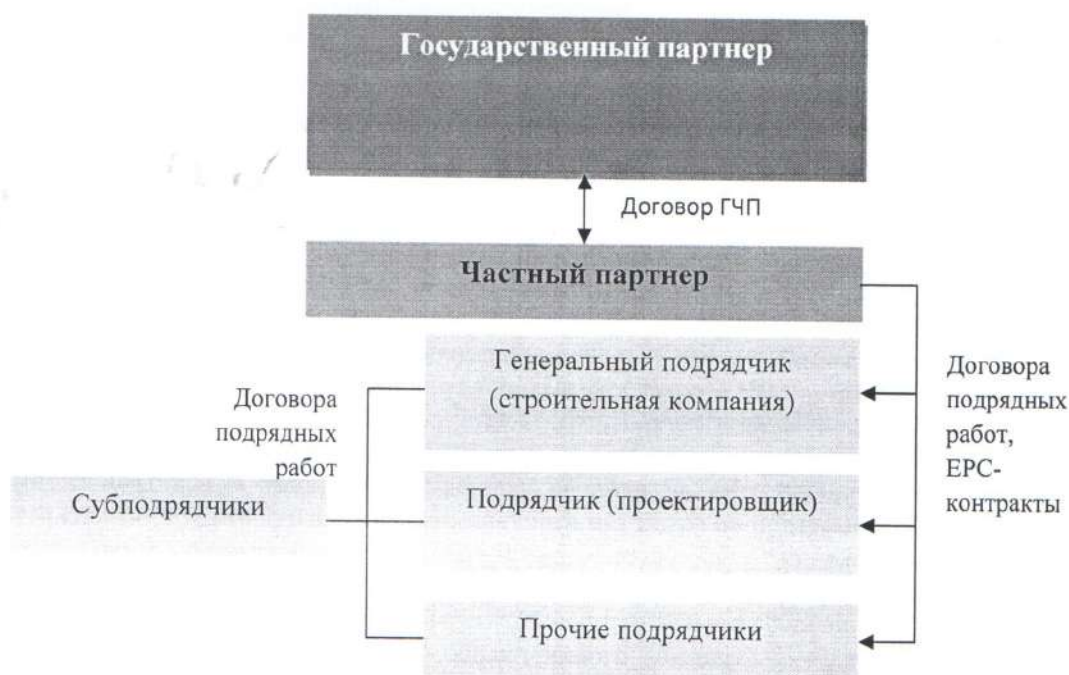
Рисунок 1 - Организационная схема взаимодействия сторон в инвестиционный период

Ниже представлена схема ГЧП по взаимодействию сторон в инвестиционный период.